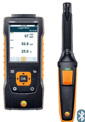
Figure : Exemple d'instrument de mesure du CO 2 portable.

Un instrument qui affiche directement la valeur mesurée sur un écran présente l'avantage de pouvoir réaliser facilement une mesure instantanée, et éventuellement une information directe des occupants dans le local.